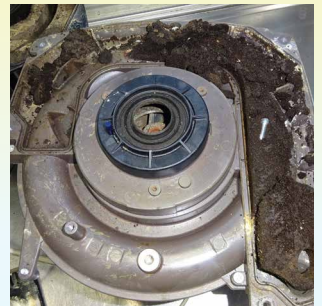
Realität in der Sauganlage: Wenn die Reinigung fehlt (Dürr Dental)