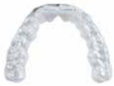
V-Print splint Therapeutische Schienen, Hilfs- und Funktionsteile die Diagnose betreffend, Bleaching-Schienen (Home-Bleaching)

Beim Kauf von 4 Flaschen erhalten Sie eine weitere gratis dazu 4+1*