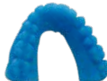
V-Print model fast Schnelldruckbare Modelle, speziell für die dentale Tiefziehtechnik