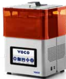
REF 9100 SolFlex 170 3D-Drucker

Kostenloser Musterdruck unter www.voco.dental