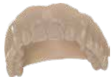
V-Print Try-In Einprobekörper für die Prothetik