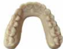
V-Print model Gesamtes Modellspektrum der Zahntechnik