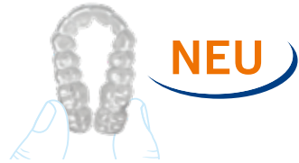
V-Print splint comfort* Therapeutische Schienen, Hilfs- und Funktionsteile die Diagnose betreffend, Bleaching-Schienen (Home-Bleaching)