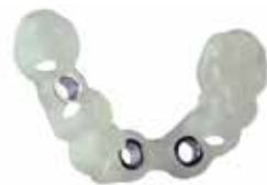
V-Print SG Dentale Bohrschablonen