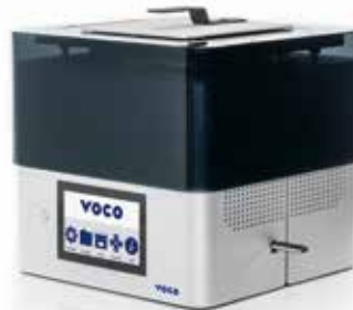
REF 9104 SolFlex 650 3D-Drucker