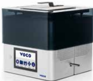
REF 9102 SolFlex 350 3D-Drucker