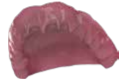
V-Print dentbase Prothesenbasen für die abnehmbare Prothetik