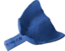
V-Print tray Individuelle Löffel, Basisplatten und Bissregistrare