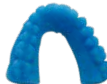
V-Print model fast Schnelldruckbare Modelle, speziell für die dentale Tiefziehtechnik