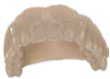
V-Print Try-In Einprobekörper für die Prothetik