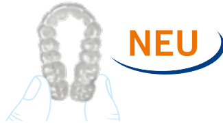
V-Print splint comfort Therapeutische Schienen, Hilfs- und Funktionsteile die Diagnose betreffend, Bleaching- Schienen (Home-Bleaching), Gaumenplatten