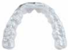
V-Print splint Therapeutische Schienen, Hilfs- und Funktionsteile die Diagnose betreffend, Bleaching-Schienen (Home-Bleaching)