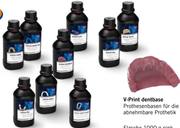
V-Print dentbase Prothesenbasen für die abnehmbare Prothetik

Beim Kauf von 4 Flaschen erhalten Sie eine weitere gratis dazu