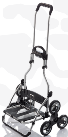
8930.1 Mobility Trappen transporter