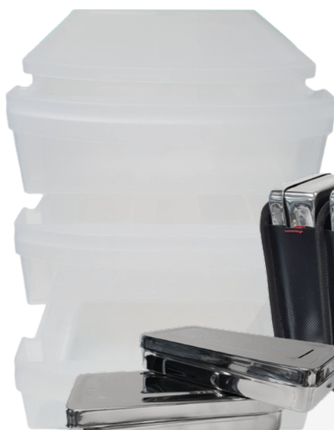
8930.7 Mobility Ladenbox