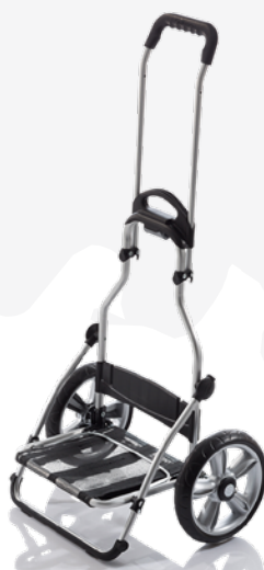
8930.2 Mobility Trolley transporter