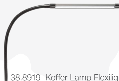
38.8919 Koffer Lamp Flexilight