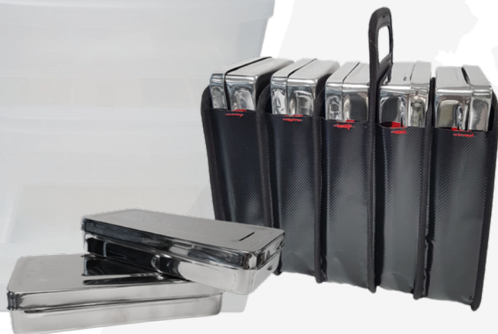
1618516 Instrumentenbox + deksel RVS