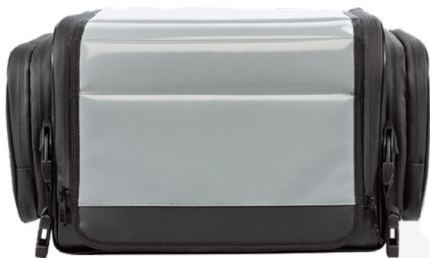
8930.3 Mobility Apparatuurtas