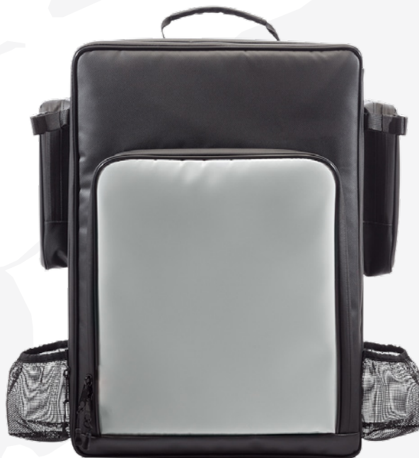
8930.4 Mobility Verzorgingseenheid