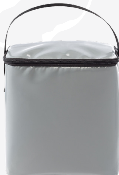
8930.6 Mobility Koeltas