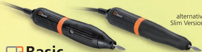
alternativ: Slim Version